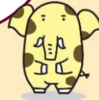
新座市イメージキャラクター 「ゾウキリン」