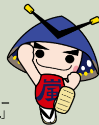
嵐山町マスコットキャラクター 「むさし嵐丸」